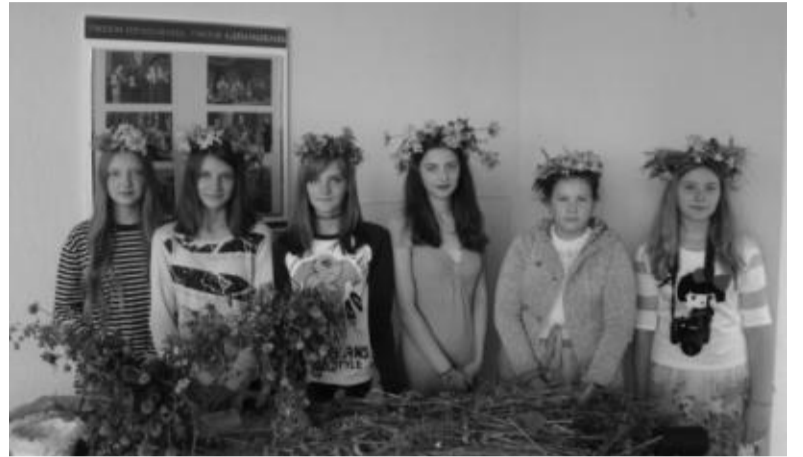
Mergaitės pasipuošusios pačių nusipintais Žolinės vainikais.