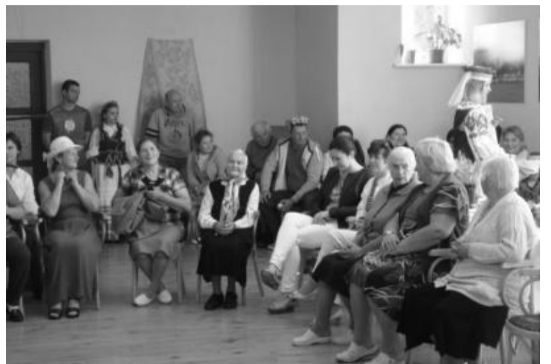
Smagu visiems drauge švęsti.