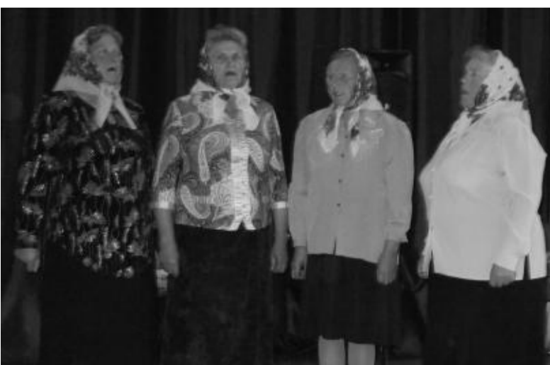
Scenoje Peleos močiutės.