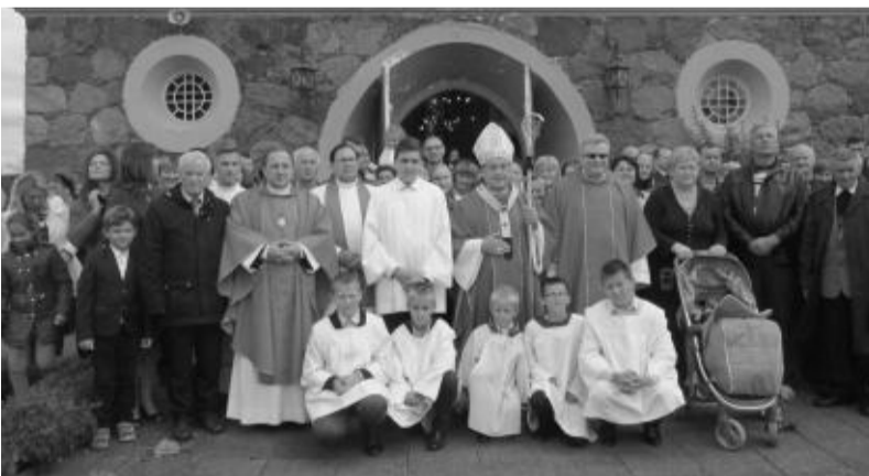
Po Šv. mišių visi drauge prie bažnyčios.