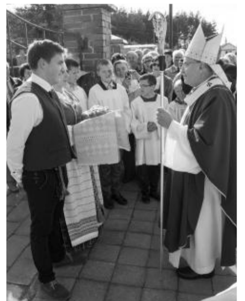
Arkiyvyskupas sutinkamas su duona ir druska.