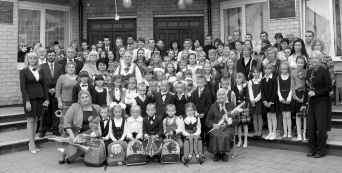
Visi rugsėjo pirmosios šventės dalyviai drauge prie mokyklos.