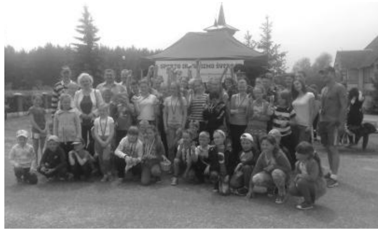
Tradicinė sporto ir turizmo šventė Pelesoje.