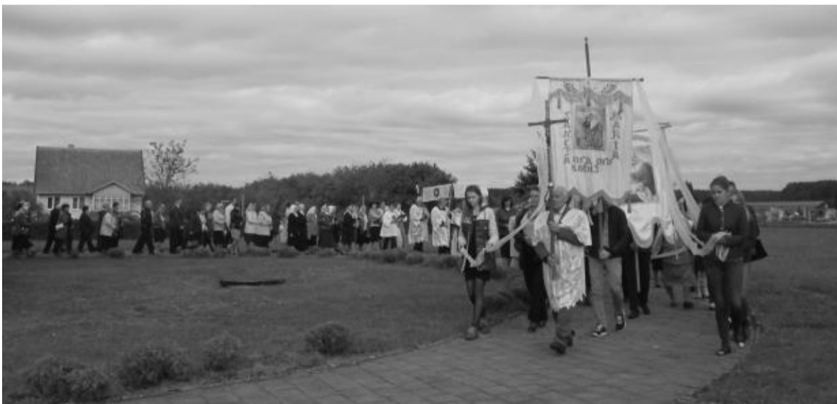
Šv. Lino atlaidų procesija.