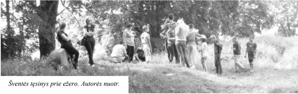
Šventės tęsinys prie ežero.

Rugsėjo 1-ąją dieną pradėjome 2016–2017 mokslo metus. Mokiniai susirinko gerai nusiteikę. Jų laukė ant stalų išdėliotos nuotraukos, diskai su filmu iš kelionės po LDK pilis Baltarusijoje. Vienas po kito atėjo ir tėvai, kaimo gyventojai keli užsuko.