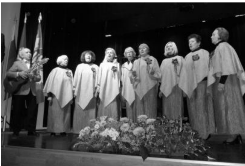
Scenoje – ansamblis „Volungė“.