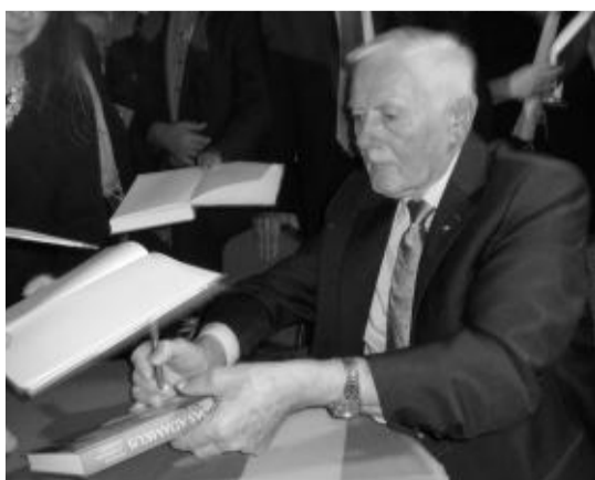
Prezidentas pasirašinėja autografus.