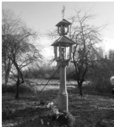
Koplytstulpis, skirtas Vinco Žemaičio atminimui Šalniškės kaime (Kazlų Rūdos sav.).