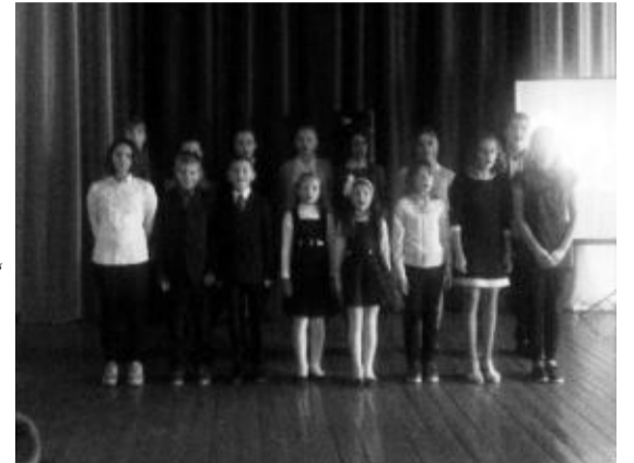
„Žvakių liepsnoje“ renginio akimirka.

Spalio 27 dieną Pelesos vidurinės mokyklos lietuvių mokomąja kalba salėje vyko įspūdingas Vėlinių minėjimo renginys „Žvakių liepsnoje“, kurį organizavo fizikos