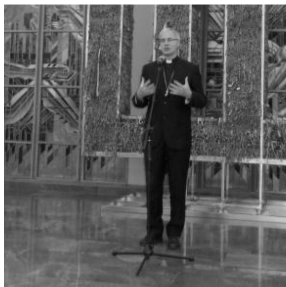
Sveikinimo žodį atidarant parodą taria vysk. Arūnas Poniškaitis.