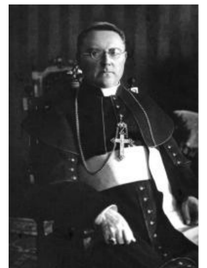
Vyskupas Justinas Staugaitis.