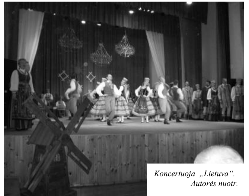
Koncertuoja „Lietuva“.